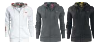
Белый (01) Темно-серый (07) Черный (90)

453318 Белый (01), Темно-серый (07), Черный (90)