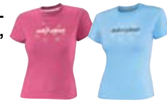
Малиновый (39) Светло-голубой (81)

Размеры: S, M, L, XL, 2XL 453295 Коричневый (04), Малиновый (39), Светло-голубой (81)