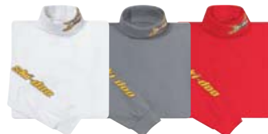
Белый (01) Темно-серый (07) Красный (30)