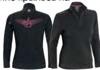
Вид сзади Черный (90)

Размеры: S, M, L, XL, 2XL 453319 Светло-голубой (81), Черный (90)