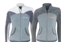
Белый (01) Темно-серый (07)

453357 Белый (01), Темно-серый (07), Дымчатый (38)