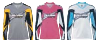
Темно-серый (07) Малиновый (39) Светло-голубой (81)

453312 Темно-серый (07), Малиновый (39), Светло-голубой (81)