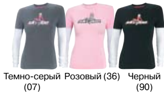
Темно-серый (07) Розовый (36) Черный (90)

Размеры: S, M, L, XL, 2XL 453297 Темно-серый (07), Розовый (36), Черный (90)