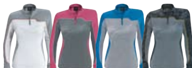
Серый (09) Малиновый (39) Голубой (80) Черный (90)

453301 Серый (09), Малиновый (39), Голубой (80), Черный (90)